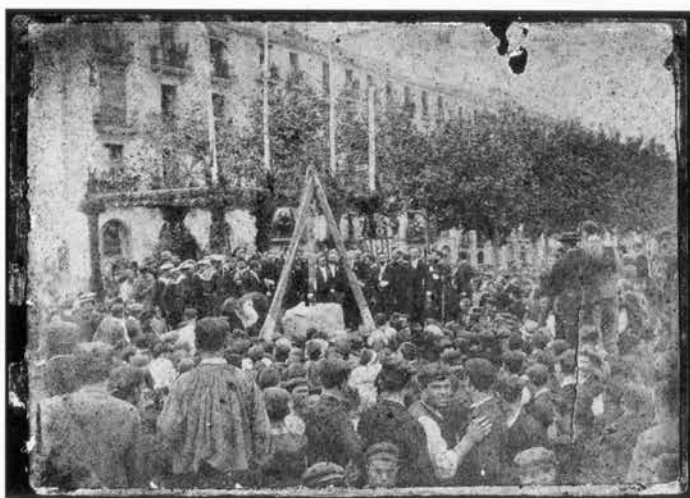
Col·locació de la primera pedra del monument a Roger de Llúria al capdamunt de la Rambla Nova. 19 d'agost de 1889.