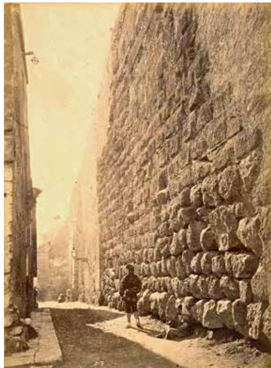
Muralla romana. Vista des de la Baixada del Roser. 1868-1879.