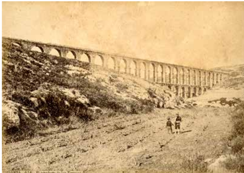
Aqüeducte romà, conegut com el Pont de les Ferreres. Anterior a 1867. (c.410)