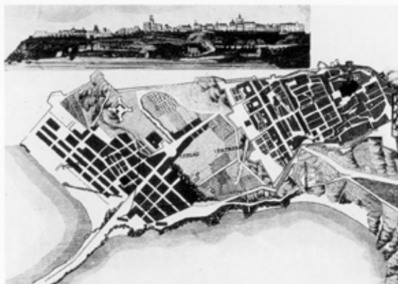
Plano y vista de Tarragona. Serie ciudades españolas . A. Roca, 1864.