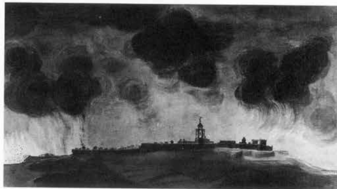
Vista de Tarragona amb els incendis provocats pels francesos el 19 d'agost de 1813, segons un dibuix de Vicenç Roig "Vicentó".