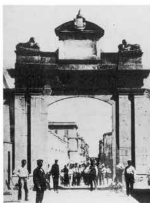
Porta del Francolí, l'any 1882, poc abans de ser enderrocada. Torres, 1882.