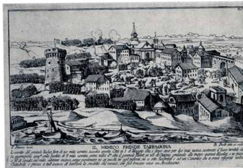
Assalt de la ciutat de Tarragona pels francesos el dia 3 de maig de 1811, segons un gravat italià de l'època. Biblioteca de Catalunya, Barcelona.

suport dels comuns, mentre Reus tenia el dels masons. De ser certa l'afirmació i d'atribuir-li una causa lògica, voldria dir que a Tarragona hi primava una ideologia lligada als sectors més radicals del liberalisme. Confirmaria aquesta hipòtesi el fet que Tarragona es convertís, a les acaballes del règim constitucional, primer en el darrer reducte dels liberals, sobretot dels membres de la Milícia Nacional i, després de la nova ocupació de la ciutat pels francesos, en el lloc de refugi per als compromesos amb el règim caigut. Encara que aquests dos fets es trobaven afavorits per altres causes, el primer perquè era l'única localitat realment fortificada i el segon perquè hostatjava una guarnició francesa, que actuava com a únic element protector dels liberals contra l'afany de renja reialista. Més simptomàtica del compromís liberal tarragoní és la fundació el