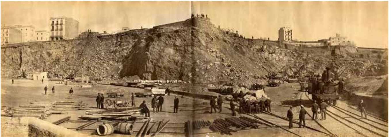
La pedrera del port. Estat en el que es trobava l'any 1871. 1871.