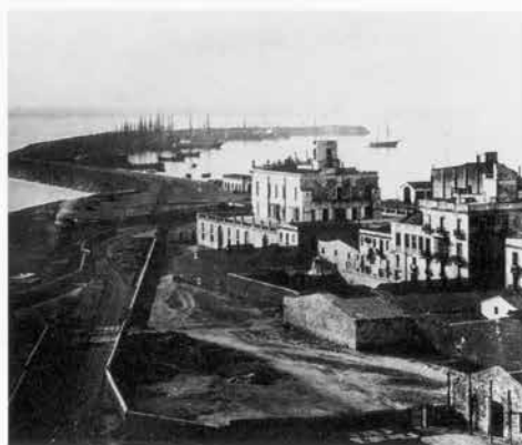
Vista del port des de la ciutat. J. Laurent, 1870.