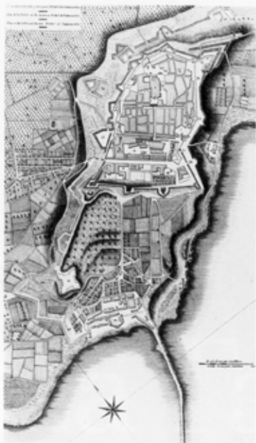
Plànol del port i la ciutat de Tarragona. A. de Laborde, Voyage pittoresque et historique de l'Espagne , Paris 1806.