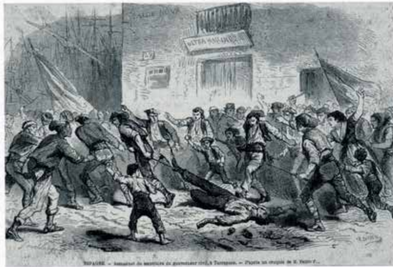
Assassinat del governador civil de Tarragona en funcions el 20 de setembre de 1869, segons una il·lustració de la revista francesa L'Illustration del 16 d'octubre de 1869. Biblioteca de Catalunya. Barcelona.

marge d'error, almenys pel que fa referència a la vida i l'activitat pública, en una divulgada cita d'A. de Magriñà, "el caciquismo arriba, la corrupción abajo, la podredumbre por todas partes. Electores que se venden y candidatos que se compran. La apatía, el egoismo y el indiferentismo reinan. Para que corporaciones den alguna señal de vida es necesario que tengan que proveer algún cargo retribuido". Malgrat tot, sota la vida oficial, poc o molt protocolària, ben lligada pels representants del poder central, es mantenia viva la flama del republicanisme federal, que rebrotaria amb nova empena al període finisecular; com es mantenia viu també, però més propens a la decadència, el carlisme. En canvi, el catalanisme organitzat irracional més enllà del pur sentimentalisme localista, féu una aparició força tardana a Tarragona.