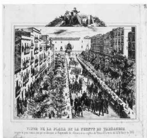
Vista de la plaça de la Font durant el banquet ofert al regiment d'Albuera al seu retorn de la guerra del Marroc el 12 de maig de 1860.