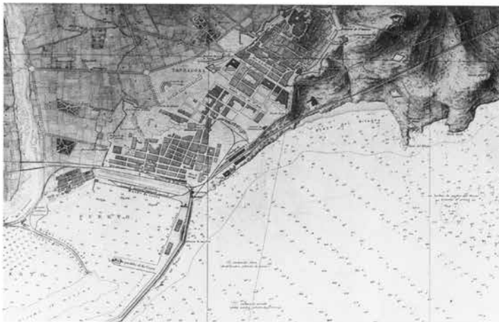
Plànol de la ciutat de Tarragona i del seu port, aixecat el 1880 per la Comisión Hidrogràfica dirigida pel capità de fragata D. Rafael Pardo de Figueroa.