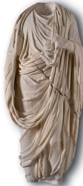
Togat, segle I dC

I vosaltres, teniu algun tipus d'amulet? Hi creieu?