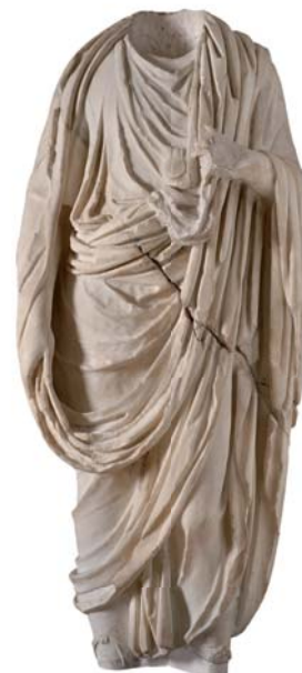
Togat, segle I dC

I vosaltres, teniu algun tipus d'amulet? Hi creieu?