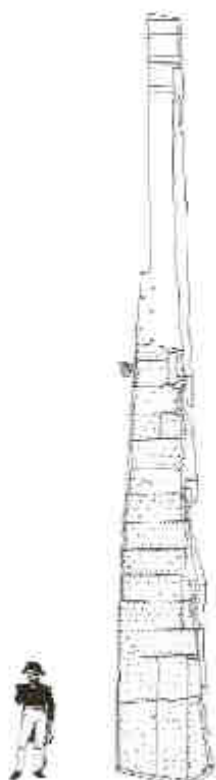
Llargada del timó: 9,50 m