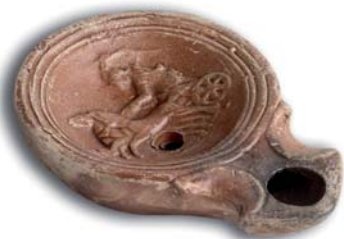
Llàntia romana, segle I dC

Tot i que l'ús de les llànties va ser molt extès en època romana i feien servir motlles per fabricar-les, avui us proposem fer-ne una manualment per experimentar com seria la il·luminació a la nit.