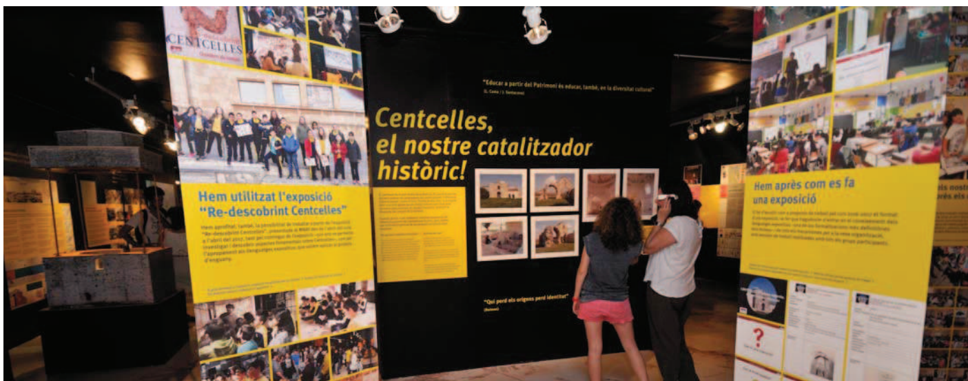
Vista general de l'àmbit Centelles, el nostre catalitzador històric!

La finalitat és que els centres l'incorporin com a eix de treball dels seus projectes educatius i que s'estableixi un treball col·laboratiu entre tots els participants.