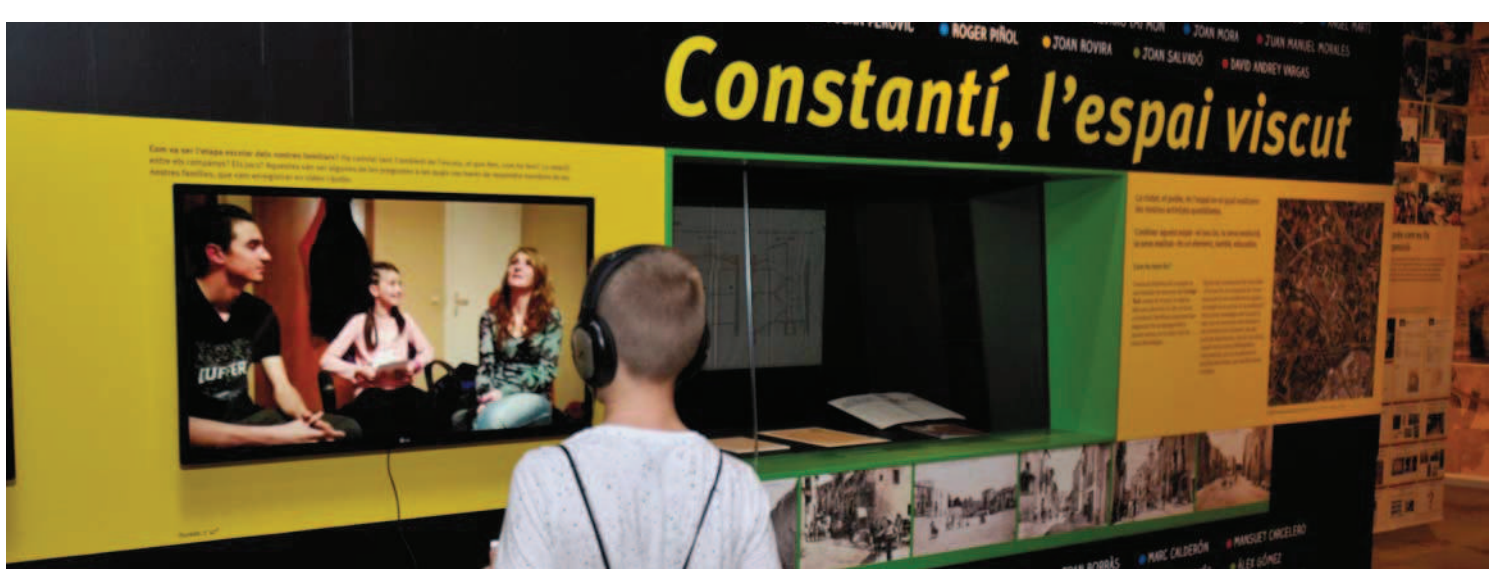
Els materials interactius i els audiovisuals són una part important de l'exposició

Conèixer Centelles ens ha permès apropar-nos a l'època romana, a la seva arquitectura, als canvis socials, polítics i ideològics de l'Imperi Romà, al seu art... Ens ha proporcionat, també, un coneixement de l'evolució històrica del territori més pròxim i a la vegada ens ha obert a l'interès per altres patrimonis en diferents formats i en diferents llocs.