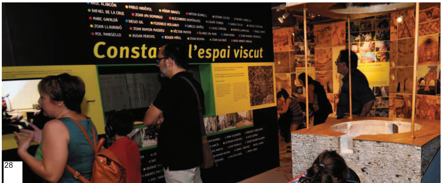
Maqueta de Centelles realitzada per un dels centres educatius que participa en el projecte, que tanca el primer àmbit de l'exposició i connecta amb el segon àmbit, que recull la metodologia de treball utilitzada en el projecte i a l'entorn de Centelles