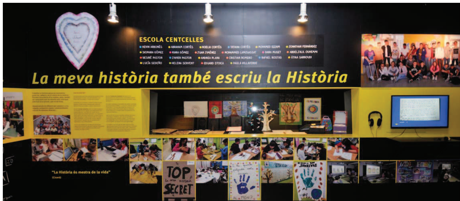
Vista de la part corresponent a la història personal –La meva història també escriu la història– de l'àmbit Estirant del fil de la història

Per intentar respondre-les vam concretar què ens agradaria saber, o què ens serviria d'ajuda per avançar en aquest coneixement. Vam pensar que seria interessant partir del que tenim més a prop: nosaltres, les nostres famílies, els nostres avant-passats, les nostres escoles i el nostre poble. La meva història també escriu la història , Història de les escoles de Constantí i Constantí , l'espai viscut constitueixen els apartats d'aquest àmbit, en els quals han estat treballant durant tot el curs els diferents centres participants i que ens mostren des de la història/les històries personals, l'evolució dels espais educatius pròxims, fins a arribar a l'espai comú, que és Constantí. En un recorregut que ens porta des del moment actual fins a les portes de Centelles, l'element patrimonial més antic que es conserva a Constantí –eix del nostre projecte– i que se'ns ofereix com un element de desenvolupament del coneixement històric.