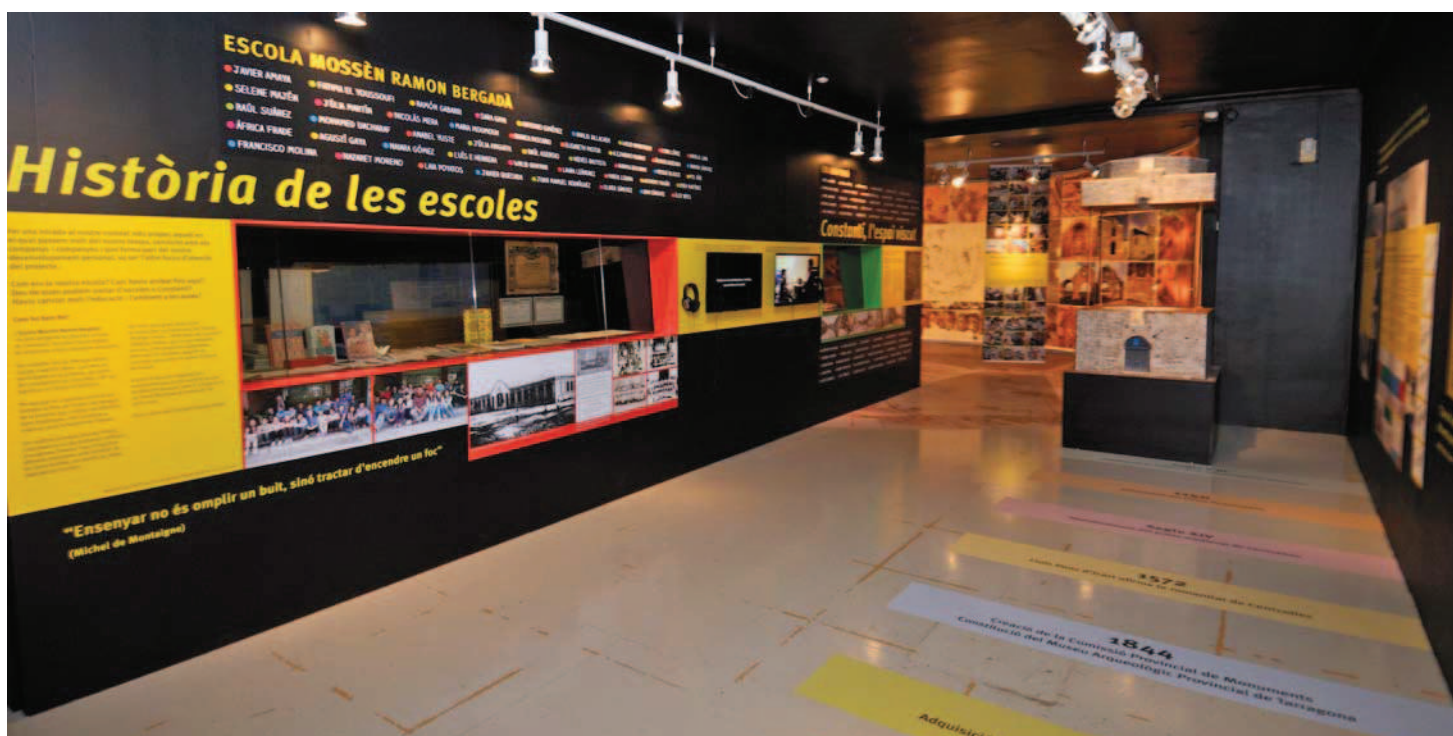
Vista general de l'àmbit Estirant del fil de la història

El nostre projecte ha partit d'un element patrimonial fonamental per a Constantí, el conjunt monumental de Centelles, exemple singular de la tardoantiguitat a Hispània. Un exemple clar, també, de la funció que el patrimoni pot tenir en aquests moments i del seu paper com a generador de coneixement, de formació i d'implicació en el desenvolupament territorial i social proper.